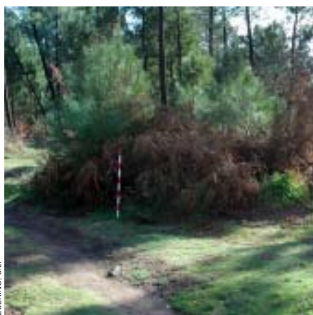
Mámoas 1 e 2 da necrópole megalítica do Ferradouro, situada en Herminde, Candeán

Nunha gran superficie cha se encontran diseminados na actualidade preto de corenta megalitos ou mámoas de diferentes medidas que se atopan en