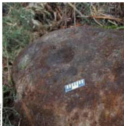
Dúas vistas dos grupos I (arriba) e II do petróglifo O Peimallo, situado en Peimallo-O Freixo, Valadares